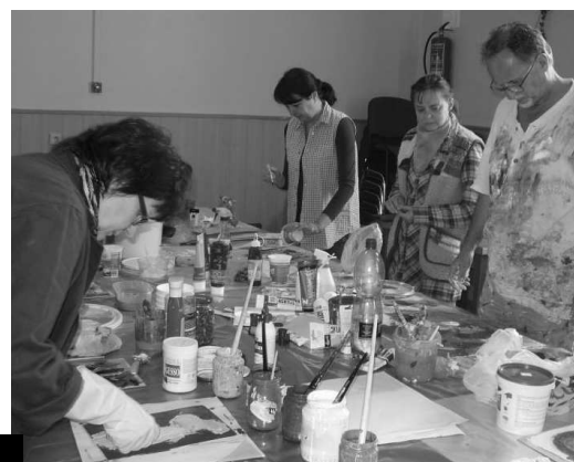
Záujemcovia o fotografickú, výtvarnú a filmovú tvorbu sa tentoraz stretli na tvorivých dňoch vo Vinici