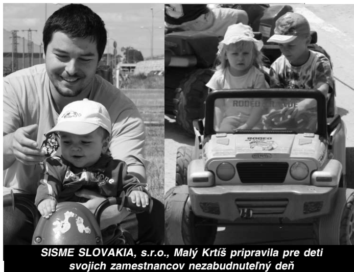
SISME SLOVAKIA, s.r.o., Malý Krtíš pripravila pre deti svojich zamestnancov nezabudnuteľný deň