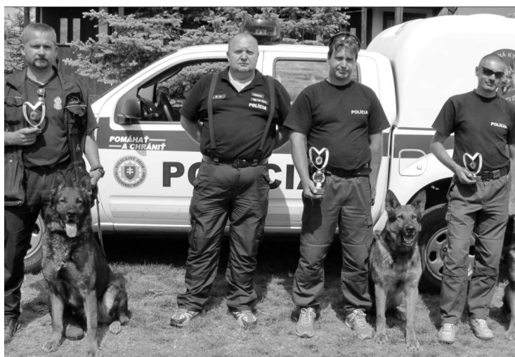
Víťazi v disciplíne vyhľadávanie výbušnín.