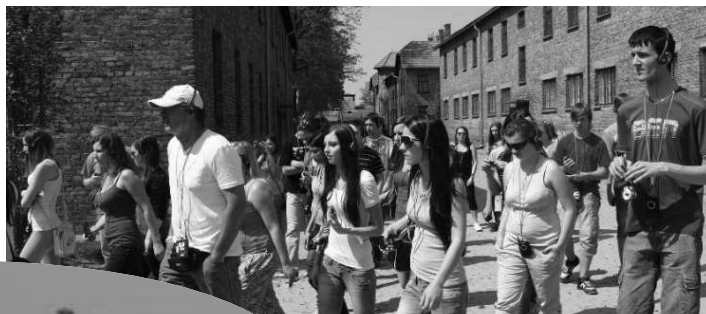
Gymnazisti na svojich cestách po Európe tentoraz zavítali do susedného Poľska. Silné emócie v nich vyvolala najmä návšteva Oswienčimu

PaedDr. PAVEL ANTOLOV