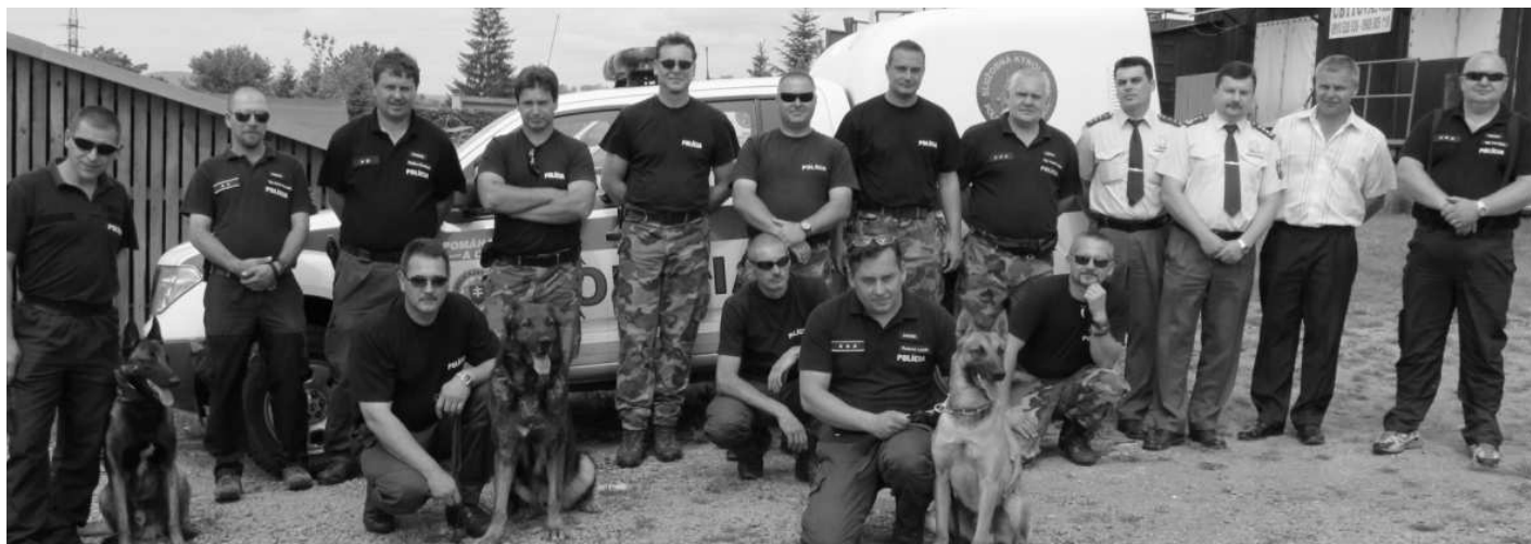
Účastníci Majstrovstiev kraja v špeciálnej kynológii služobných psov.