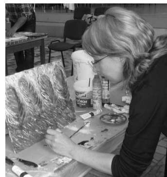
Účastníci odchádzali z podujatia obohatení o nové vedomosti a skúsenosti