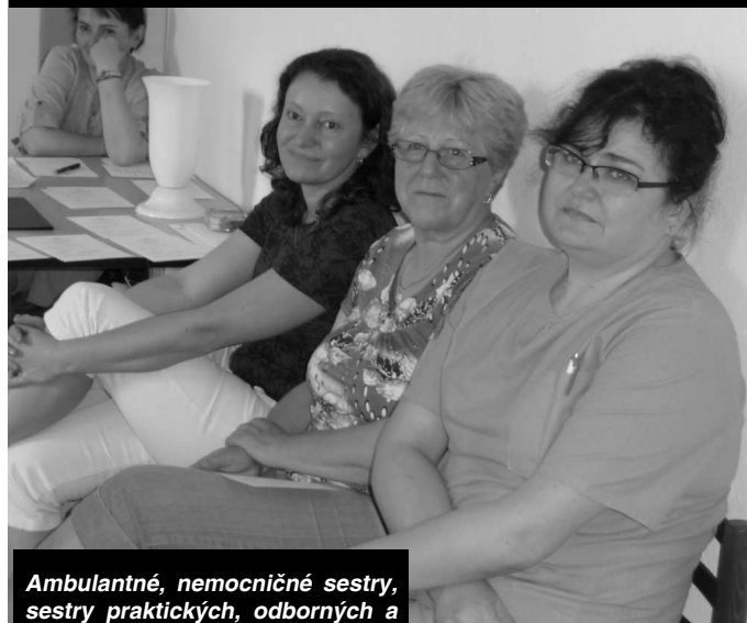
Ambulantné, nemocničné sestry, sestry praktických, odborných a zubných lekárov si na seminári vypočuli aj odborné prednášky