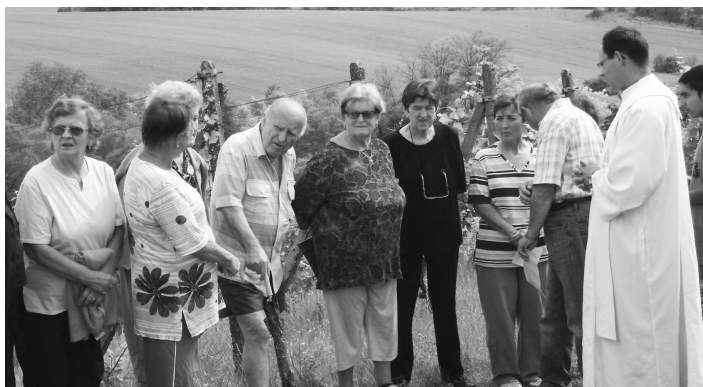
Vdp.Lukáš Jókay vysvätil sochu sv. Urbana a kaplnku