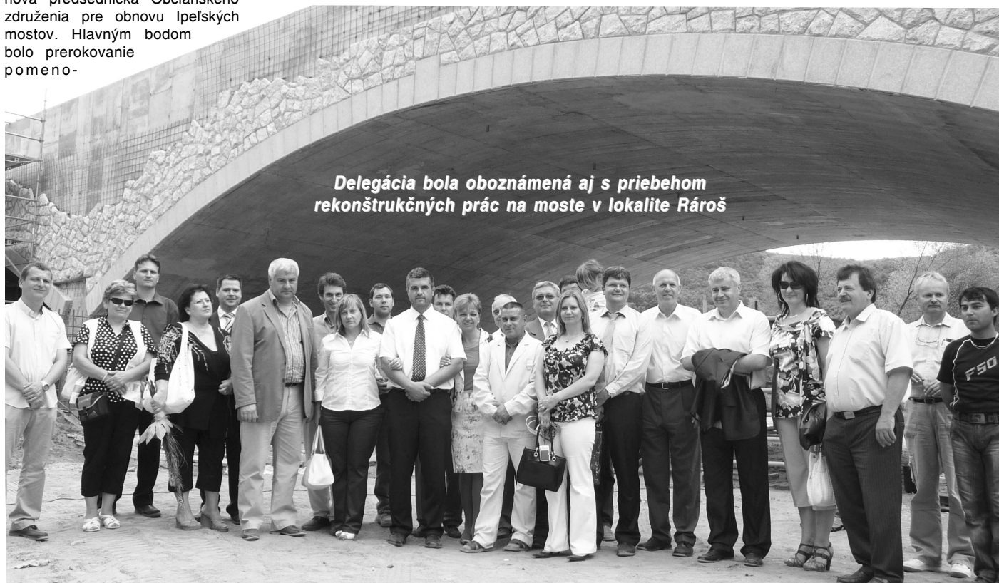
Delegácia bola oboznámená aj s priebehom rekonštrukčných prác na moste v lokalite Rároš