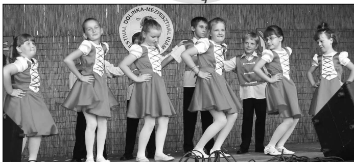
Najviac sympatií si získali mladí školáci a škôlkari z Dolinky i dievčatá z B. Ďarmôt.