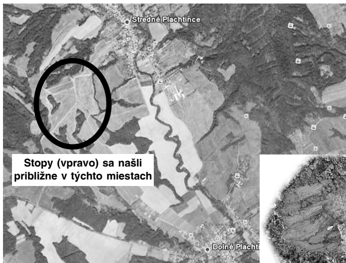
Stopy (vpravo) sa naši približne v týchto miestach

2. Ak sa približuje a je dosť ďaleko, v tichosti a pokojí odíďte.