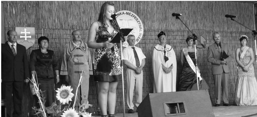
Z pódia prírodného amfiteátra pozdravili významní hostia festivalu i prítomných návštevníkov.