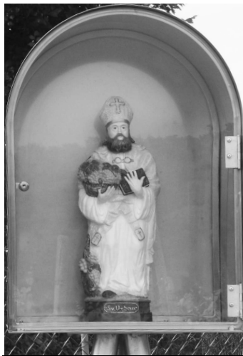
Sochu sv. Urbana, patróna vinohradníkov, majú už aj vo V.Zlievcach

V našom okrese sa začali vytvárať osady záhradkárov a základné organizácie záhradkárov okolo roku 1970. Aj vo V.Zlievcach, v časti chotára Drahobín, vznikla v rokoch 1977 -1979. Zdevastovanú pôdu, ktorú dostali záhradkári na svoju činnosť, zúžitkovali, skultivovali, skultúrnila a zveladili.