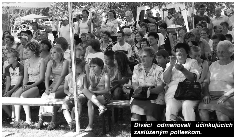
Diváci odmeňovali účinkujúcich zasluženým potleskom.