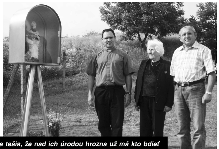
Obyvatelia obce sa tešia, že nad ich úrodou hrozna už má kto bdieť