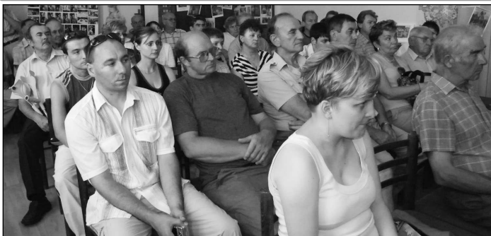
O informácie na odborných prednáškach sa zaujímali mladí i starší chovatelia včiel.