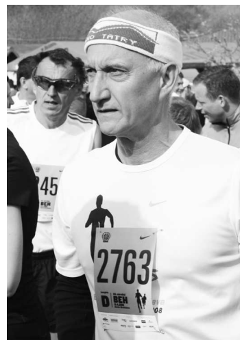
Spisovateľ si vo voľnom čase rád zašportuje. Na fotke pred behom Devín - Bratislava