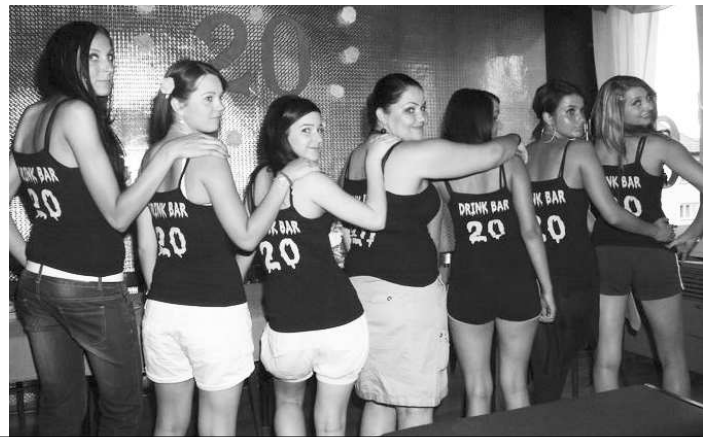
V tvárach mladých ľudí, ktorí predniesli "rozlúčkovú reč" sa dala čítať vďaka, láska, úcta ale aj smútok za tým, že 20 ročná éra Drink-baru v Neninciach končí.