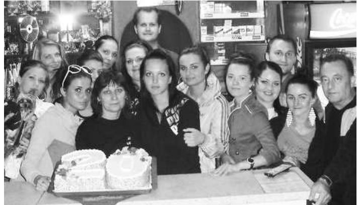
Na rozlúčkovej párty nechýbala štýlová torta aj tričká, ohňostroji, ale aj smútok v tvárach prítomných

Skupinka prvej generácie návštevníkov Drink-baru z rokov 1991 - 2001.