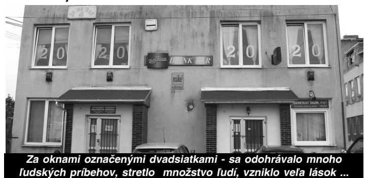
Za oknami označenými dvadsiatkami - sa odohrávalo mnoho ľudských príbehov, stretlo množstvo ľudí, vzniklo veľa lások ...