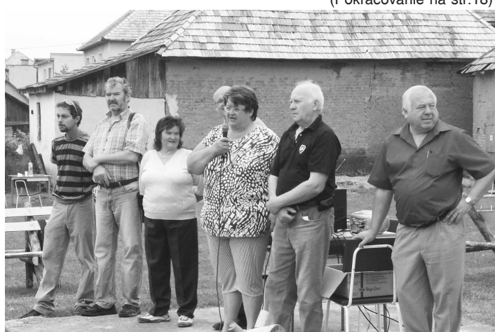
Slávnostné otvorenie a športový deň sa môže začať