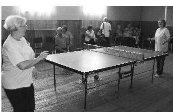
Jednou z populárnych disciplín je aj stolný tenis