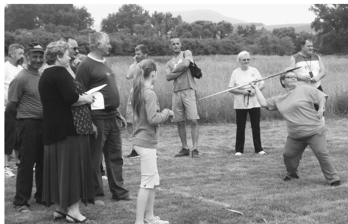
Postoj tejto oštepárky bol takmer profesionálny.