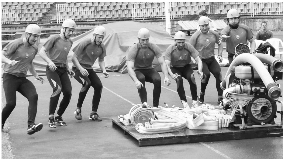
Požiarny útok našich hasičov

V dňoch 2. - 3. júna 2011 sa uskutočnil XV. ročník Krajskej súťaže v hasičskom športe v Banskej Bystrici, ktorého sa zúčastnilo aj súťažné družstvo z Veľkého Krtíša. Osem súťažných družstiev okresných riaditeľstiev (Lučenec, Rimavská Sobota, Zvolen, Brezno, Revúca, Žiar nad Hronom, Banská Bystrica, Veľký Krtíš) si zmeralo sily počas dvoch dní v disciplínach 100 m cez prekážky, štafeta 4 x 100 m, výstup do tretieho poschodia cvičnej veže a ukončila to kráľovská disciplína požiarny útok.