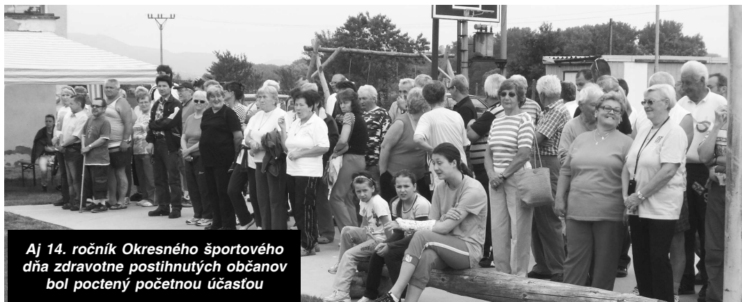
Aj 14. ročník Okresného športového dňa zdravotne postihnutých občanov bol poctený početnou účasťou

- ORGANIZAČNÝ VÝBOR -