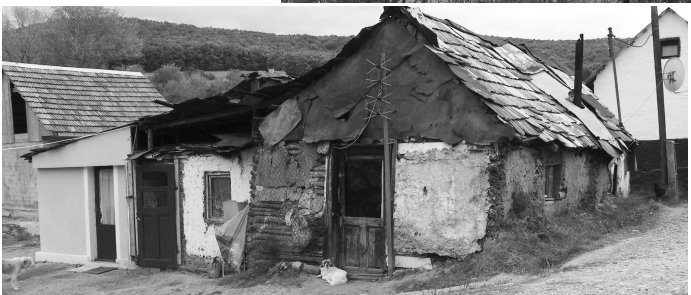
Toto "súdomie", ktoré obyvatelia osady Hôrka volajú aj bytovkou a kostol v obci, mali rovnaké súpisné číslo 1.