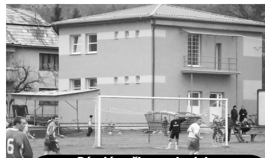
Bývalá požiarňa zbrojnica zrekonštruovaná z eurofondov na klub mládeže a šatne pre futbalistov