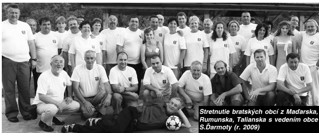
Stretnutie bratských obcí z Maďarska, Rumunska, Talianska s vedením obce S.Ďarmoty (r. 2009)

■ Tretí ročník súťaže e-Bike, pohár Mountain Bike, súťaž Olympijských nádejí, V4, slovenský a maďarský pohár. Na pretekoch sa zúčastnilo 560 pretekárov, vyše 1000 účastníkov a