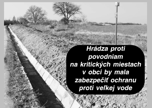
Hrádza proti povodňiam na kritických miestach v obci by mala zabezpečiť ochranu proti veľkej vode