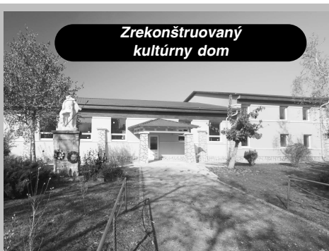
Zrekonštruovaný kultúrny dom