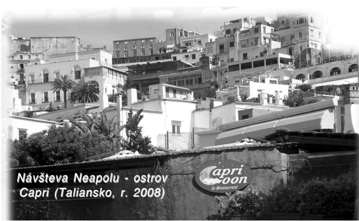
Návšteva Neapolu - ostrov Capri (Taliansko, r. 2008)