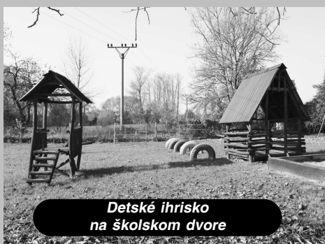
Detské ihrisko na školskom dvore