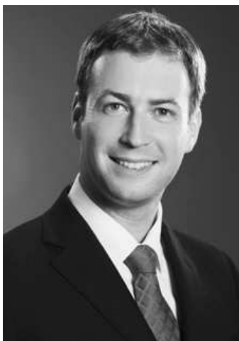
MAREK BLAHA, predseda SDĽ

Nová SDĽ, ktorá zaujala voličov už pred parlamentnými voľbami, sa zapája do politiky aj na komunálnej úrovni. Ľavičari do komunálnych volieb postavili skoro tisícku kandidátov na poslancov, starostov a primátorov. "Máme vlastných kandidátov na primátora v 4 krajských mestách, ďalej 20 kandidátov na primátorov, okolo 100 kandidátov na starostov obcí a viac ako 900 kandidátov na poslancov," - informoval