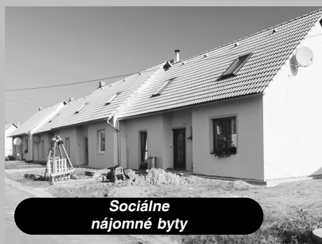
Sociálne nájomné byty