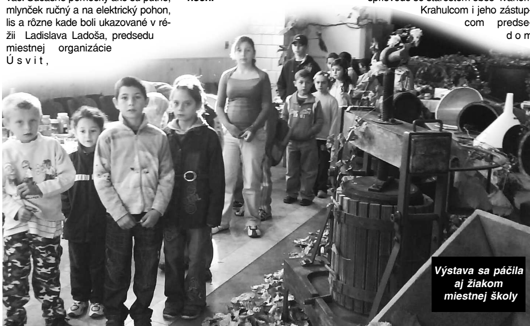
Výstava sa páčila aj žiakom miestnej školy

Text: GABRIEL BELA, st.