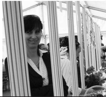
Súčasťou sympózia bola i prehliadka krojov a tradičných jedál

Pri tejto príležitosti sa v Srbsku v obci Selenča 25. a 26. septembra konalo III. sympózium s medzinárodnou účasťou Výroba ekologických potravín a rozvoj cestovného ruchu. Hlavným organizátorom zaujímavého podujatia bolo Združenie pre zdravé životné prostredie a biopotraviny "ZDRAVO-ORGANIC" Selenča v spolupráci s inštitúciami zo Srbska, ale i Slovenska (Slovenská agentúra medzinárodnej rozvojovej spolupráce, Slovenská poľnohospodárska univerzita v Nitre) a Regionálny úrad FAO pre Európu a Strednú Áziu. Jedným z hlavných cieľov podujatia bola Propagácia a popularizácia možností aktívneho využívania menej známych a netradičných druhov rastlín vo výžive, poľnohospodárstve a v sociálno-ekonomických programoch rozvoja vidieka, rozvoji cestovného ruchu a ochrane životného prostredia. Prvý deň sympózia bol venovaný odborným témam, ku ktorým prednášali odborníci v oblasti pestovania ekologických potravín zo Srbska i Sloven-