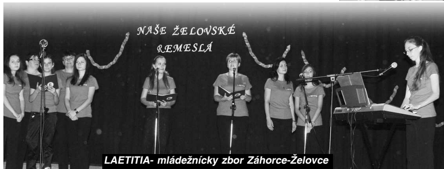
LAETITIA- mládežnícky zbor Záhorce-Želovce