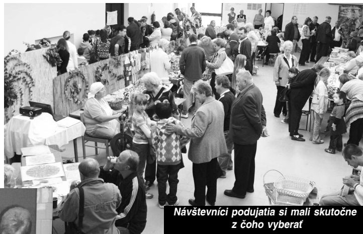
Návštevníci podujatia si mali skutočne z čoho vyberať