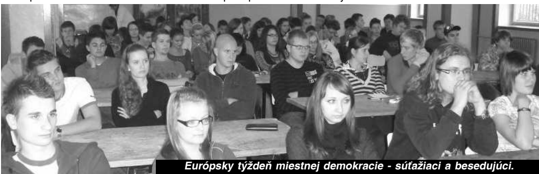
Európsky týždeň miestnej demokracie - súťažiaci a besedujúci.