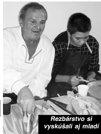
Rezbárstvo si vyskúšali aj mladí