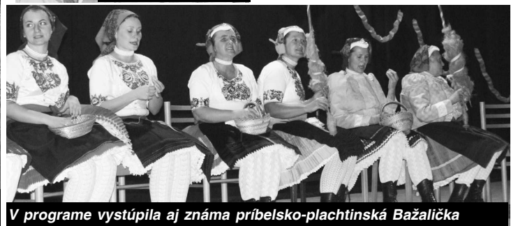
V programe vystúpila aj známa príbelsko-plachtinská Bažalička

rovali aj voňavé a chutné želovské špeciality. Od rôznych koláčov cez zemiakové placky a pagáče až po pečenú klobásu, chlieb s masťou a cibulou a vynikajúce varené víno s liečivými účinkami. Na príprave domácich špecialít sa podieľali ochotné Želovčanky, ktorým ďakujeme za zabezpečenie výbornej ochutnávky. (Pokračovanie na str.7)