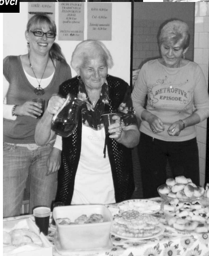
Tradičná želovská kuchyňa, na ktorú sa všetkým zbíehali slinky

"Finančné prostriedky na realizáciu tohto podujatia sme získali prostredníctvom úspešných projektov: "Pôvodné naše želovské remeslá" - ktorý bol podporený z Ministerstva kultúry SR, programu Kultúra národnostných menšín 2009. Taktiež to bol projekt s názvom "Remeslami k upevňovaniu a zachovaniu zručností a tradícií". Okrem toho sa na úspešnej realizácii podujatia podieľal i Obecný úrad Želovce a mnohí sponzori, ktorým touto cestou ďakujeme za podporu. Bez nej by bola táto akcia chudobnejšia a naše starosti o