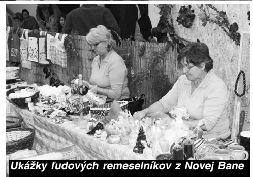
Ukážky ľudových remeselníkov z Novej Bane