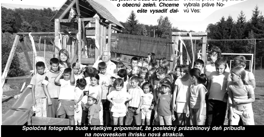
Spoločná fotografia bude všetkým pripomínať, že posledný prázdninový deň pribudla na novoveskom ihrisku nová atrakcia.

"Máme v pláne opraviť kultúrny dom - vymeniť okná za plastové, vymalovať budovu