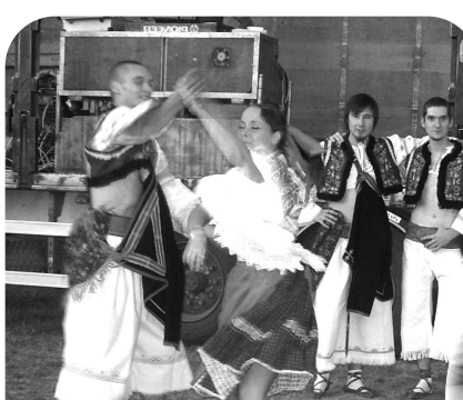
Slávnostný večer umocnený kultúrno-sportovým vystúpením, ako aj chuťným občerstvením, zavŕšilo zapálenie veľkej vaty a ohňostroj na večernej oblohe.