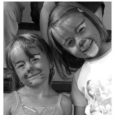
Návštevníci dňa obce sa cítili skvele, všade rozváňal guláš a vládla pohoda