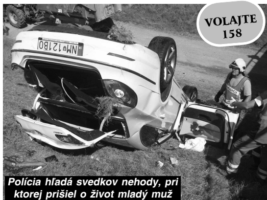
Polícia hľadá svedkov nehody, pri ktorej prišiel o život mladý muž

Akkoľvek informácie, vedúce k zisteniu totožnosti svedkov priebehu dopravnej nehody a okolností vedúcich k jej vzniku, oznámte na ktoromkoľvek útvere Policajného zboru alebo na známom telefónnom čísle 158.