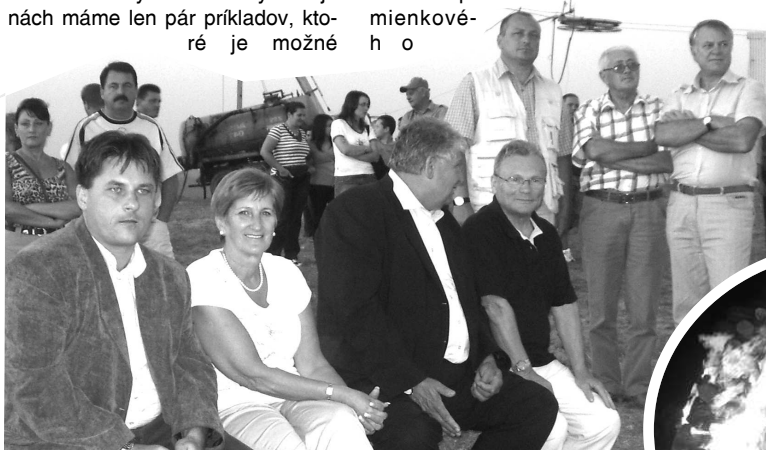
Okresní a krajskí predstavitelia politickej strany SMER - SD pripravili spomienkovú slávnosť k 65. výročiu SNP na Dačovom Lome pri lyžiarskom vleku.