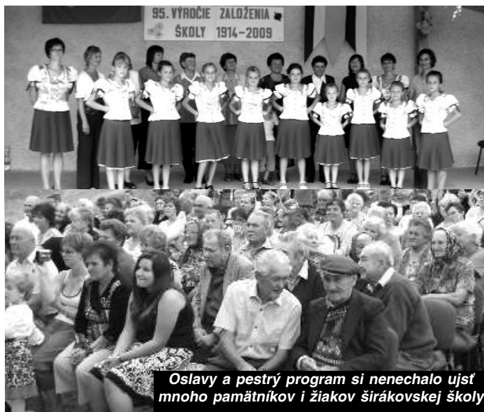
Oslavy a pestrý program si nenechalo ujsť mnoho pamätníkov i žiakov širákovskej školy