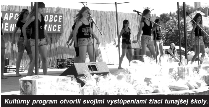
Kultúrny program otvorili svojimi vystúpeniami žiaci tunajšej školy.