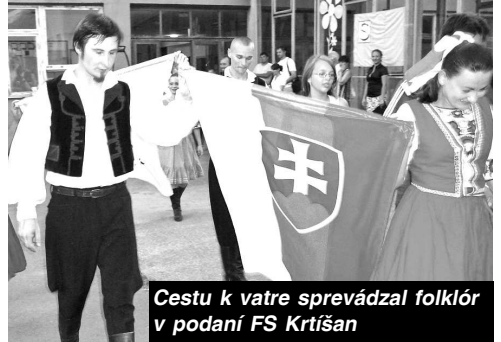
Cestu k vatre sprevádzal folklór v podaní FS Krtíščan

Namiesto záveru malé pripomenutie: Deklarácia bola aktom politickým, nie koštitučným, pretože ňou automaticky nevznikal samostatný štát. Bola však jasným signálom navonok, že zá-