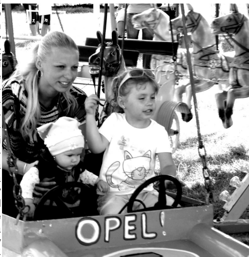
Deti i dospelí mali o zábavu postarané počas celého popoludnia