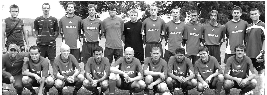
Futbalový klub Sklabiná získal v V.lige sk.D bronz. Okrem tohto krásneho úspechu sa teší aj vernému fanklubu (na foto dole), ktorý na svojich hráčov neďá dopustiť

Stretnutie tak skončilo hokejovým výsledkom 5:5, ktorý bol z pohľadu