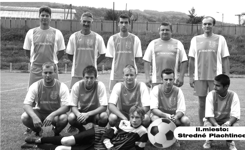
II.miesto: Stredné Plachtince