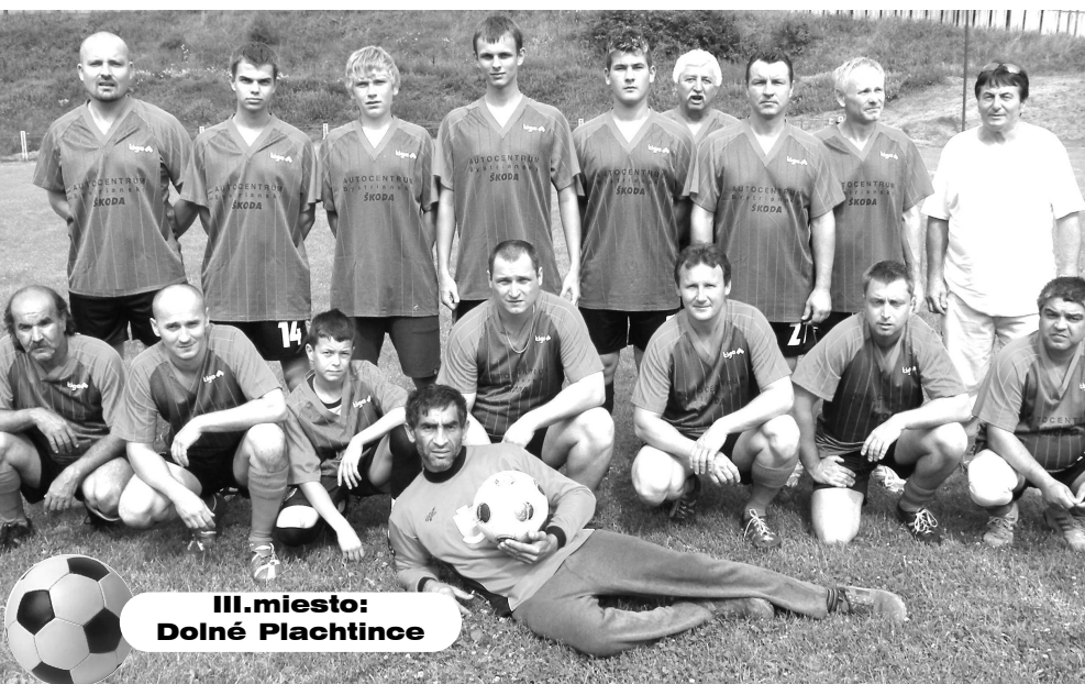
III.miesto: Dolné Plachtince