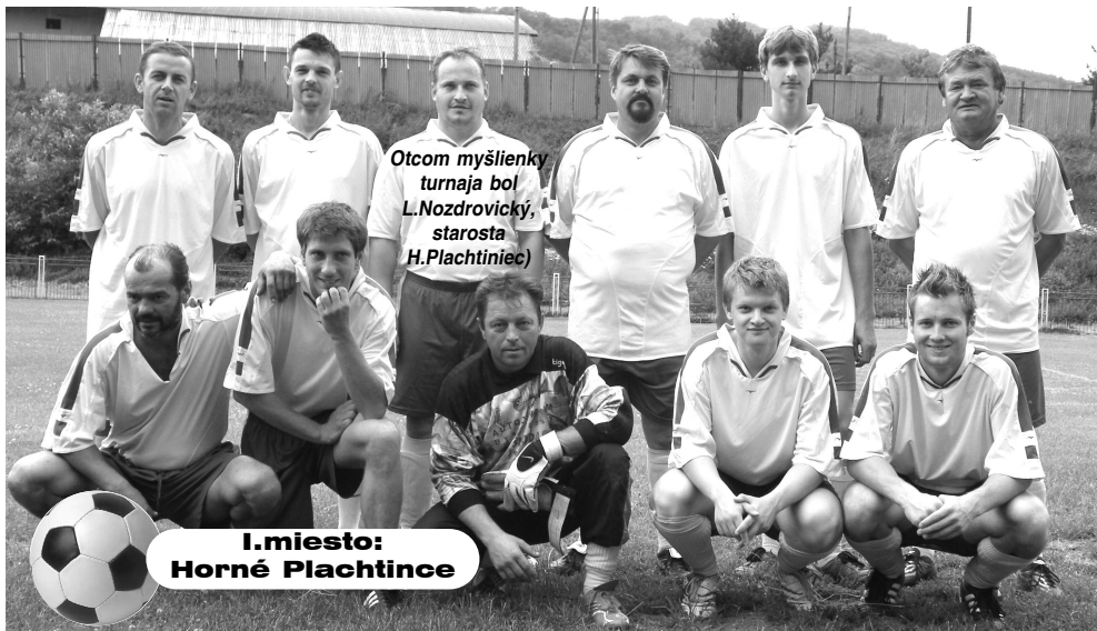
I.miesto: Horné Plachtince