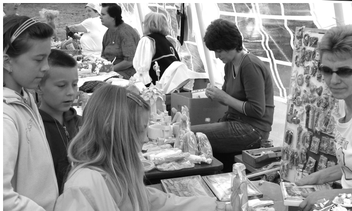
O prácu ľudových majstrov sa zaujímali nielen dospelí, ale aj deti.