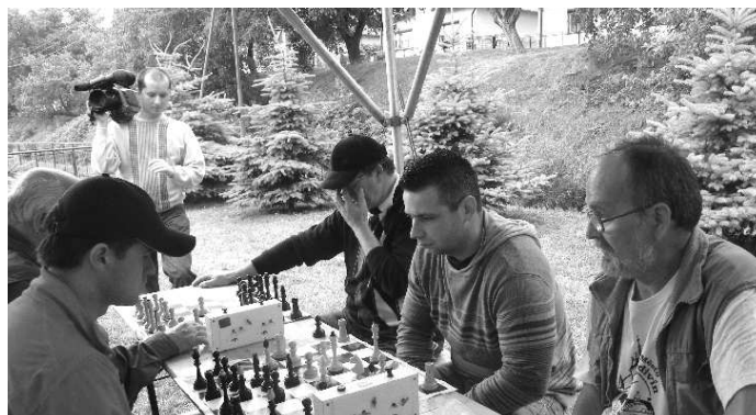
Pri varení ostal čas aj na partiu šachu. Čebovskí šachisti však hostí presvedčili, že sú predsa len o triedu lepšími šachistami

neskorý zber 2008. Celkovo porota udelila 30 Zlatých, 53 Strieborných a 43 Bronzových medailí. O to, či porota rozhodla naozaj správne sa mohli návštevníci višegrádskeho stretnutia presvedčiť na ochutnávke. Ing. L. Ďord i ostatní organizátori z OZ Geruša, OZ Motiv, OcÚ Čebovce i Višegrádskeho fondu veria, že Festival vín v Čebovciach získa popularitu, a aj ďalšie ročníky budú aspoň také úspešné, ako ten tohtoročný. Veď Čebovce sú svojou produkciou vína známe už dlhé roky a nie iba na Slovensku. -P.G.-