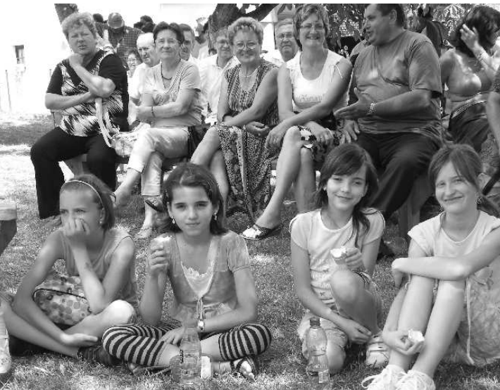
V pestrom kultúrnom popoludní si tie svoje programy našli malí i veľkí diváci