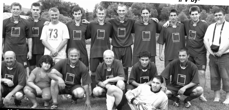
Mužstvo výberu SDKÚ z BBSK v súboji s maďarskými súpermi tesne prehrali.