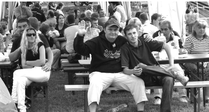
Pri sledovaní kultúrneho programu bolo divákovi veselo.