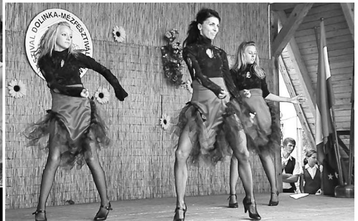
Tanečnice z I. Sokolca zaujali svojim umením i kostýmami