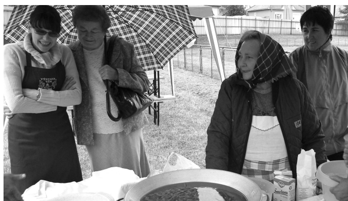
České kuchárky zaujalo aj to, že do guláša v Maďarsku dávajú i zelenú fazuľku.