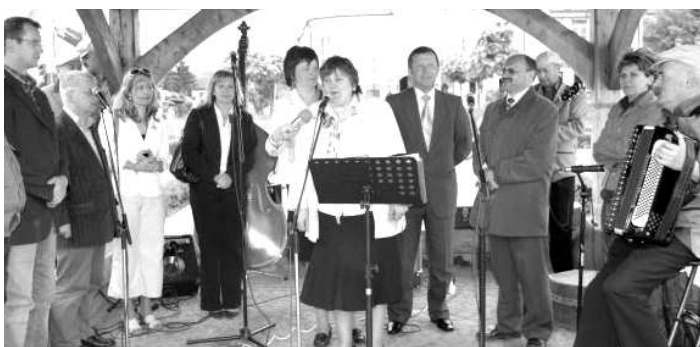
Delegácia z M. Kameňa na otvorení kultúrneho podujatia "JARMARK OPATOWSKI".

Tu sa mohli Slováci započúvať do pekných Poľských piesní, či pozrieť veľmi zaujímavú Ohňovú šou hasičov z Poľskej Koprovnice. Potom ich ešte čakala ochutnávka vín z produkcie domácich vinárov. Po skončení prvej oficiálnej časti dňa sa aj táto časť delegácie presunula na školské hrisko, kde sa stali divákmi na poslednom zápase modrokaň-