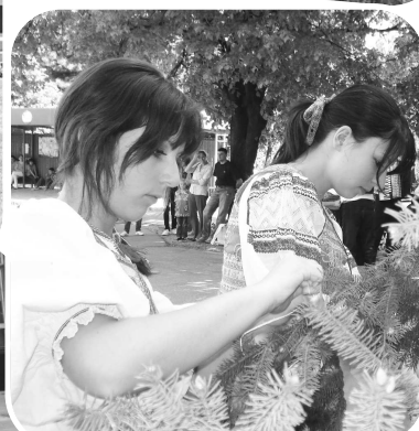
Máj najprv vyzdobili stužkami