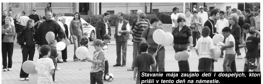
Stavanie mája zaujalo deti i dospelých, ktorí prišli v tento deň na námestie.