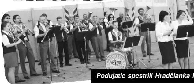
Podujatie spestrili Hradčianka i Bazaľička