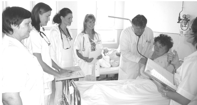
Počas vizity je pacient vyšetrený a zhodnotený jeho zdravotný stav, na základe čoho sa rozhodne o ďalšom diagnosticko-liečebnom postupe.

"V 50-55 % sú srdcovocievne ochorenia príčinou smrti dospeléj populácie. Ďalšími častými ochoreniami sú ochorenia dýchacieho systému - zápaly a nádory priedušiek aj pľúc, priedušková astma, ochorenia tráviaceho traktu, veľmi časté sú rôzne ochorenia pečene, zápaly, vredy a nádory žalúdka, dvanástnika, pažeráka, čriev, podžalúdkovej žľazy.