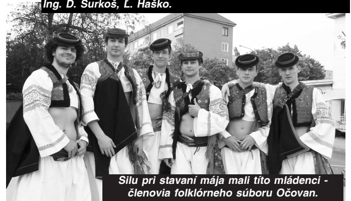
Silu pri stavaní mája mali títo mládenci - členovia folklórneho súboru Očovan.

Chlapci idú dievčatám narúbať brezy do lesa a máje stavajú v noci, ktoré potom skrásľujú prídemia domov. V strede dediny majú postavený máj zo smrekú, okolo ktorého všetci Očovania tancujú a bavia sa. Na stavanie májov nemá s p o -