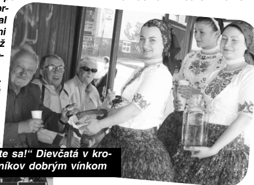
„Nech sa páči, ponúknite sa!“ Dievčatá v krojoch častovali návštevníkov dobrým vínkom