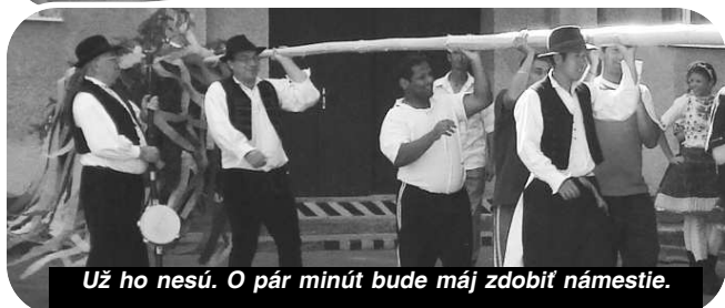
Už ho nesú. O pár minút bude máj zdobiť námestie.